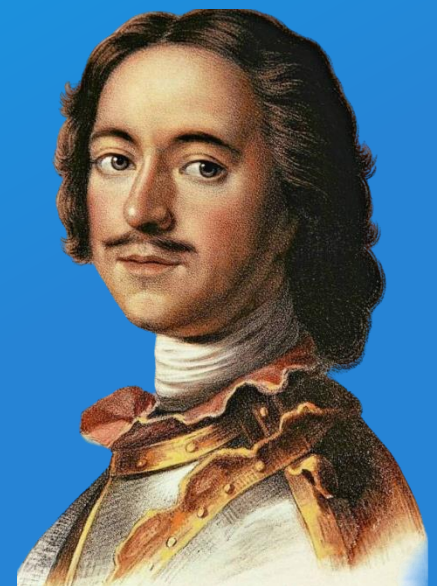
император Петра I