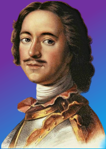
император Петра I

Заячьим его назвали, потому, что там действительно было много зайцев. Есть история, которая говорит о том, что плотники, строившие крепость работали медленно, и разгневанный Петр приплыл на остров, чтобы наказать их. Когда он выходил из лодки, ему на сапог вдруг прыгнул зайчик и так развеселил царя, что он не стал наказывать плотников, а остров назвал Заячьим.